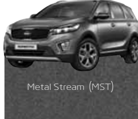
Metal Stream (MST)