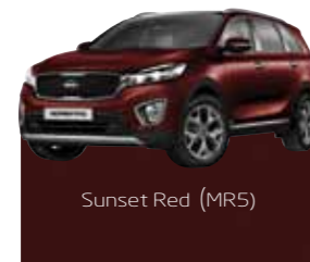
Sunset Red (MR5)