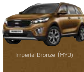
Imperial Bronze (MY3)